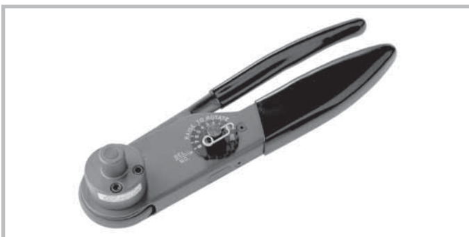
Hand crimp tool for high power contacts. Tool order number: M309 Positioner for plug: TP1071-1 Positioner for receptacles: TP1072-1 Positioner for plugs and receptacles: SP994

Handcrimpzange zum Crimpen von Koaxialkontakten (Innenleiter). Werkzeugbestellnummer: M22520/2-01