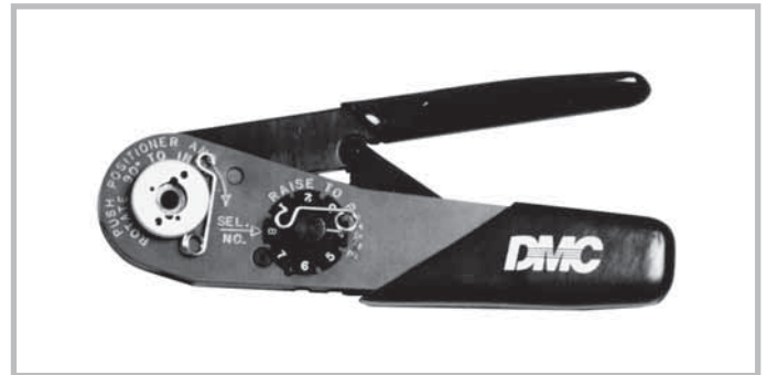
Hand crimp tool for coaxial contacts (inner conductor). Tool order number: M22520/2-01

Einsatz für Crimpwerkzeuge. Bestellnummer: Y1535P