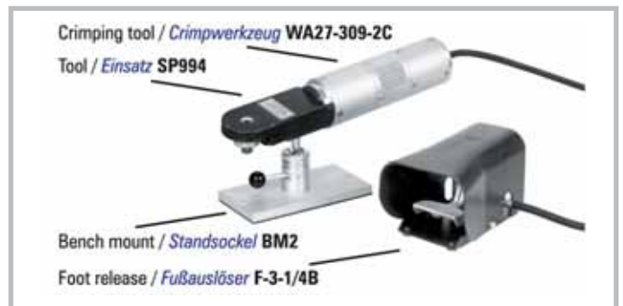
Pneumatic crimp tool for high power contacts. Tool order number: WA27-309-2C with foot release BM-2 (bench mount) SP994 (positioner) TP1071-1, TP1072-1 (positioner)

Handcrimpzange zum Crimpen von Hochstromkontakten. Werkzeugbestellnummer: M309 Einsatz für Stecker: TP1071-1 Einsatz für Steckdosen: TP1072-1 Einsatz für Stecker und Steckdosen: SP994