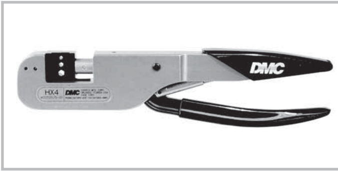
Hand crimp tool for coaxial contacts (outer conductor). Tool order number: M22520/5-01

Handcrimpzange zum Crimpen von Koaxialkontakten (Außenleiter). Werkzeugbestellnummer: M22520/5-01